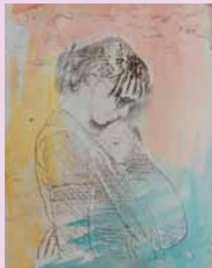
Opera di Luca Tuccolo - www.lucatuocolo.it

PER INFORMAZIONI E ISCRIZIONI: Segreteria ANPEP (tel. e fax) 0438 73429; segreteria@sedeanepep.it , oggetto: info.corsi